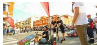
Le scuole superiori di Latina si sfidano su monoposto ecologiche: gara nella