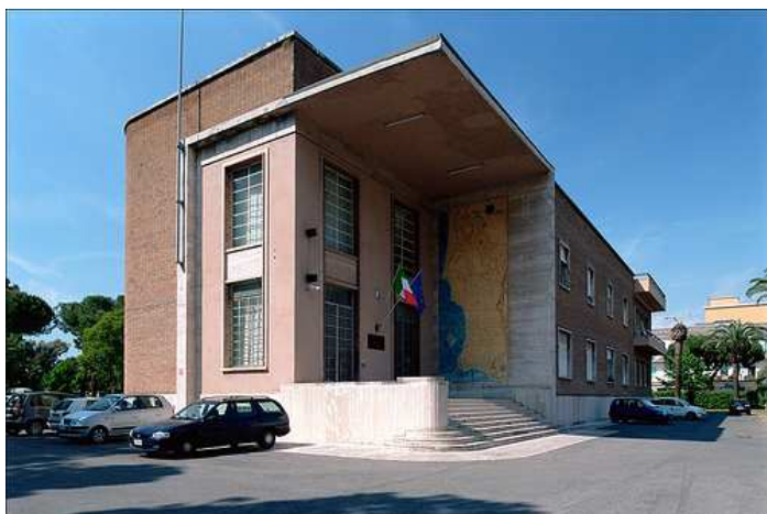
La sede del Consorzio di Bonifica a Latina

Facebook Twitter Google+ Digg LinkedIn Reddit StumbleUpon Tumblr Email RSS Print