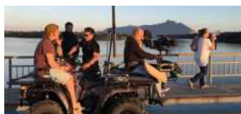
Swatch, girato a Sabaudia l'ultimo spot della casa di orologi

La tua Azienda su LunaNotizie.it e su Radio Luna? Chiama il 335 620 4691