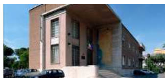
Crisi idrica, il Consorzio di bonifica dell'agro pontino lancia l'allarme