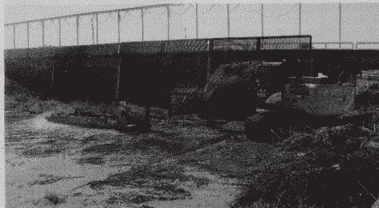
Le pulizie del Consorzio di Bonifica allo sgrigliatore di via Passerelle

Trovare addirittura dei frigoriferi insieme a un cumulo di materiali plastici e inquinanti significa non avere a cuore il futuro dei propri figli». L'assessore approfitta per ricordare che «la De Vizia Transfer spa - Urbaser assicura il servizio di ritiro gratuito a casa dei rifiuti ingombranti, che esistono due isole ecologiche fisse a Morelle e a Borgo Hermada e che ogni sabato ci sono le isole ecologiche itineranti in due punti della città, con un calendario che va dal centro alle periferie». In altre parole, gli strumenti per evitare la dispersione e lo sversamento di rifiuti nell'ambiente, ci sono. «Rimane - conclude Zappone - quella esigua fetta di persone che ancora o non si rendono conto dei danni che arrecano o, semplicemente, sono dei criminali».