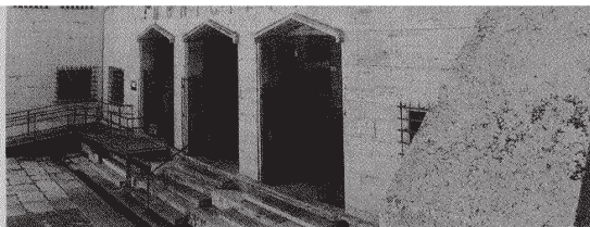
Il Comune di Terracina

un importo di circa 1 milione di euro più interessi, liquidato però al 45%. Resta una parte del credito che ammonta a circa 3 milioni di euro che invece fa parte dei cosiddetti "privilegiati", da pagare cioè al 100% dell'importo. Più gli interessi moratori, che ammontano a circa 1,2 milioni di euro. Su questi importi, tutt'altro che trascurabili, il Comune sta cercando di trattare ma Ifis non